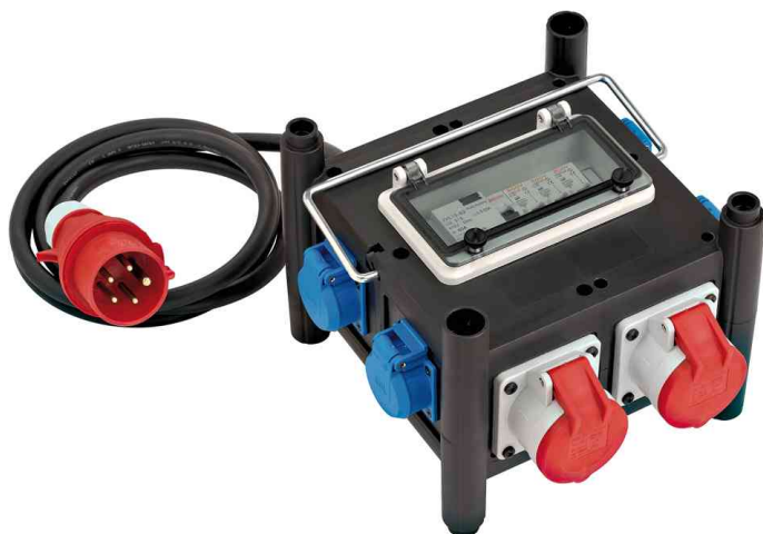
Kompakter Gummi-Stromverteiler IP 44

- für den ständigen Einsatz im Freien und auf Baustellen