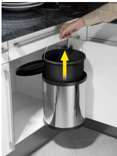
Detailansicht: herausnehmbarer Inneneimer