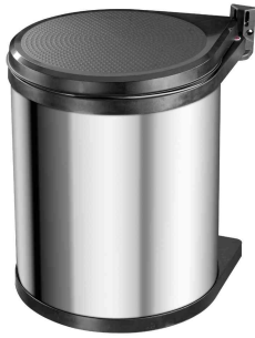
Einbau-Mülleimer Compact-Box M, Edelstahl