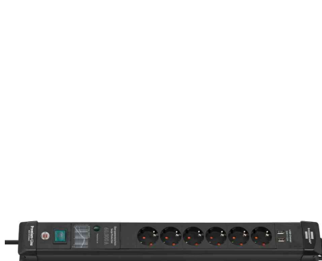
Überspannungsschutz-Steckdosenleiste Premium-Line, 6-fach