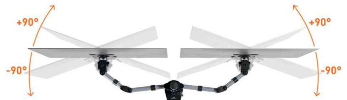
Detailansicht: 90° horizontal schwenkbar