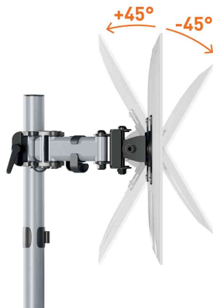
Detailansicht: 45° neigbar