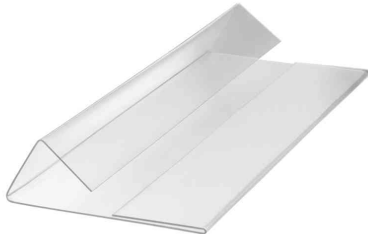
Kennzeichnungstasche HARD COVER, 1/2 A5 quer

- geeignet zum Überhängen an Kartons, Boxen oder anderen Behältern