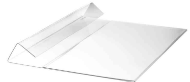
Kennzeichnungstasche HARD COVER, A5 quer