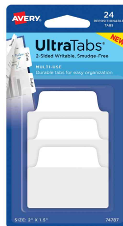
Haftstreifen UltraTabs Weiß