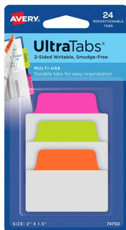
Haftstreifen UltraTabs Neon