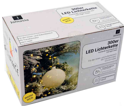
LED-Lichterkette, 300 Lichter