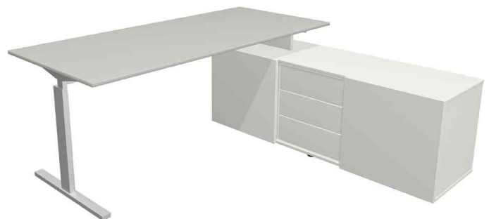
Komplett-Arbeitsplatz "Form 2", lichtgrau