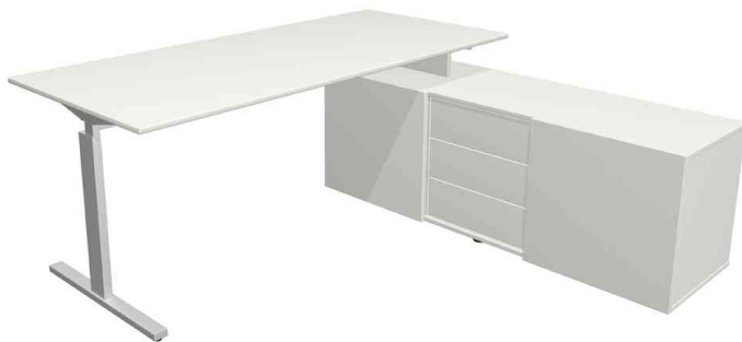
Komplett-Arbeitsplatz "Form 2", weiß