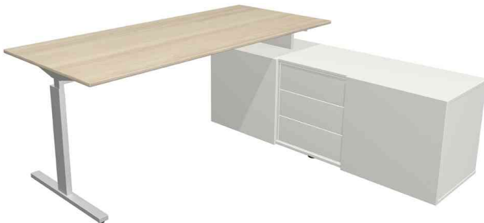
Komplett-Arbeitsplatz "Form 2", eiche