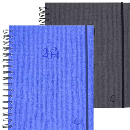
Agenda journalier de bureau "La journée planifiée 22 S", assorti

Adapté pour: - pour gérer le planning de 3 à 6 utilisateurs