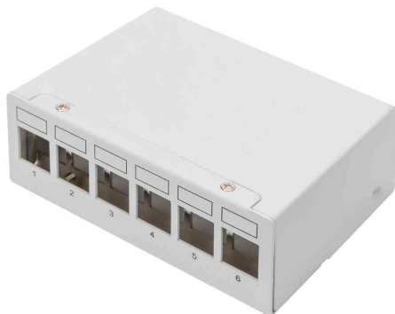
Modular Desktop Patch Panel

- die perfekte Lösung zur Organisation und Verwaltung von Netzwerkabeln in einer Vielzahl von Umgebungen wie Industrie, Datenzentren, Büros, Gebäuden und Zuhause