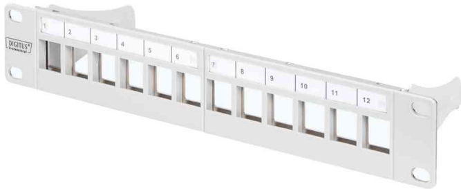
10" Modular Patch Panel