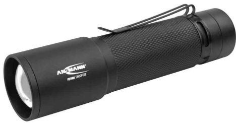
Akku LED-Taschenlampe Future T600FRB