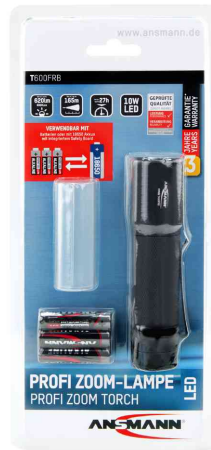
Akku LED-Taschenlampe Future T600FRB, in Blisterverpackung