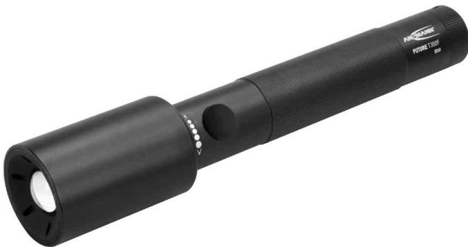
LED-Taschenlampe Future T300F