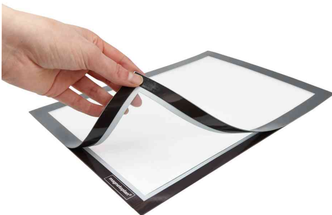
Detailansicht: aufklappbarer Magnetverschluss