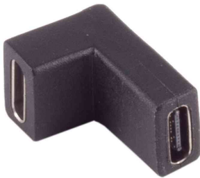
USB 3.1 Adapter, USB-C Kupplung - USB-C Kupplung