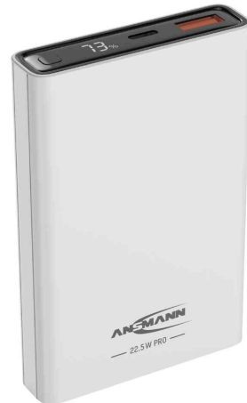
Mobiler Zusatzakku PB222PD, weiß