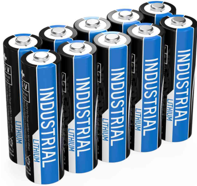
Lithium Batterie "Industrial", Mignon AA