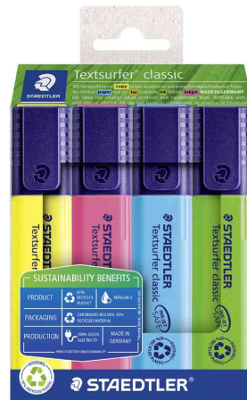
Textmarker "Textsurfer classic", 4er Etui