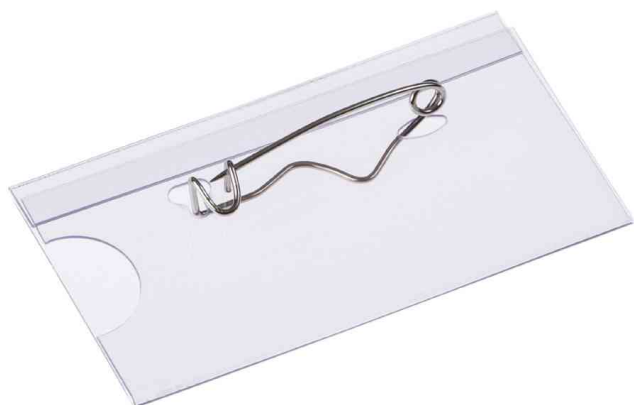
Namensschild, mit Wellennadel