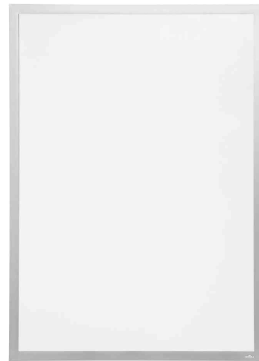
Plakaträhmen DURAFRAME® POSTER, silber