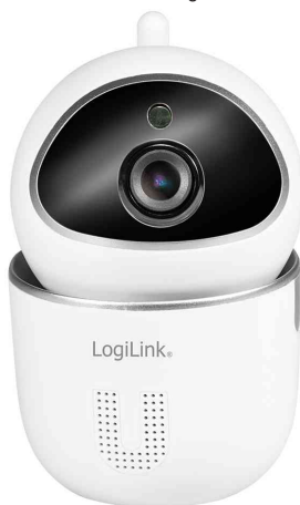
Wi-Fi Smart IP-Kamera

- beispielsweise für die Überwachung von Innenräumen aller Art, Baby- oder Haustierüberwachung