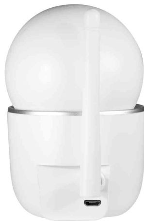
Wi-Fi Smart IP-Kamera, Rückansicht