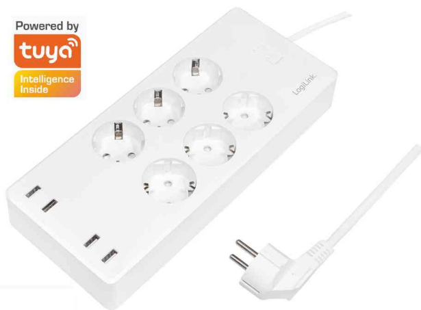
Wi-Fi Smart Steckdosenleiste, 6-fach + 4x USB