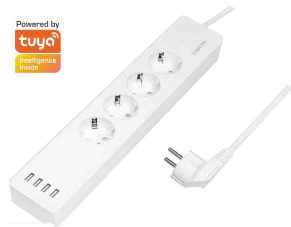
Wi-Fi Smart Steckdosenleiste, 4-fach + 4x USB