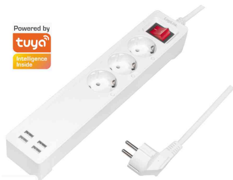
Wi-Fi Smart Steckdosenleiste, 3-fach + 4x USB