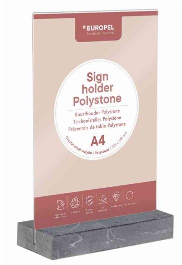
Tischaufsteller, Polystone anthrazit