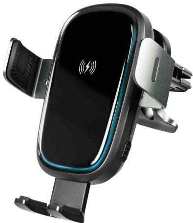
Kabellose Smartphone-KFZ-Halterung für Lüftungsschacht

- für sichere Befestigung von Mobiltelefonen und MP3-Playern im Auto