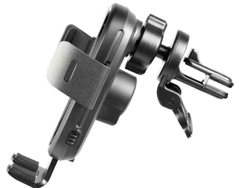
Kabellose Smartphone-KFZ-Halterung für Lüftungsschacht