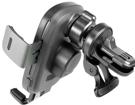
Kabellose Smartphone-KFZ-Halterung für Lüftungsschacht