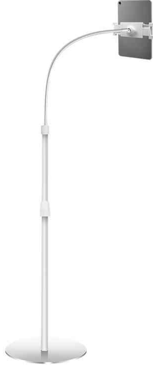
Standfuß mit Schwanenhals für Mobilgeräte