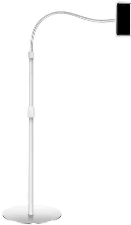
Standfuß mit Schwanenhals für Mobilgeräte

- für Handfreies lesen oder zum Schauen von Videos auf Ihrem Smartphone oder Tablet