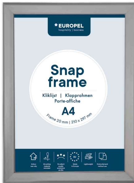
Plakatrahmen, silber eloxiert - 20 mm Rahmenprofil