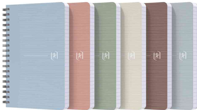
Spiralbuch My Rec'Up

SCRIBZEE® kompatibel: Die kostenlose Cloud-basierte App ermöglicht es, handschriftliche Notizen und Dokumente zu scannen, zu speichern und zu organisieren.