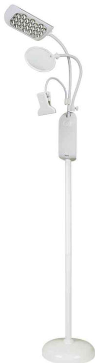
LED-Stehleuchte mit Lupe & Klemme