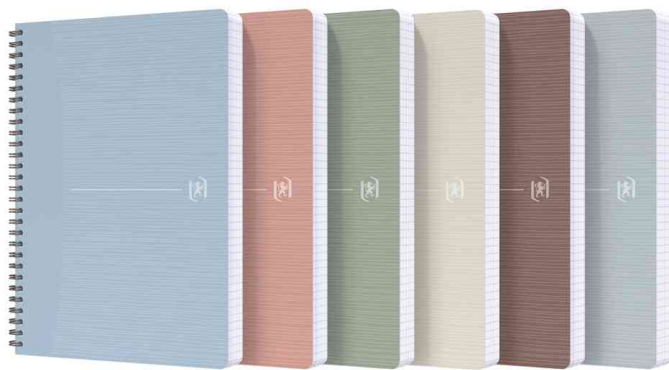
Spiralbuch My Rec'Up

SCRIBZEE® kompatibel: Die kostenlose Cloud-basierte App ermöglicht es, handschriftliche Notizen und Dokumente zu scannen, zu speichern und zu organisieren.