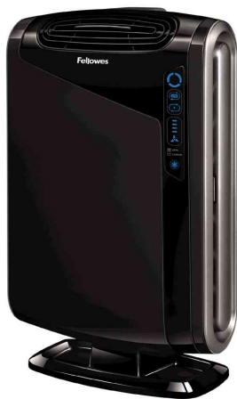
Luftreiniger AeraMax 290