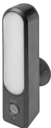
Smarte Full HD-Außenkamera

- für eine Vielzahl an Einsatzmöglichkeiten im Außenbereich konzipiert, beispielsweise für Haus, Garten, Garage oder Carport