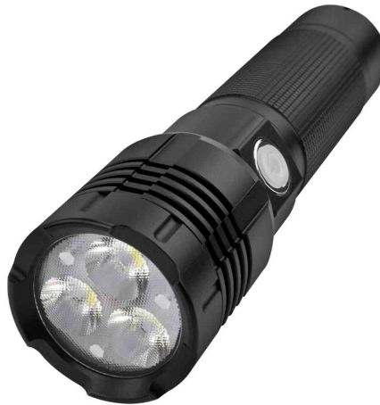
Akku LED-Taschenlampe Pro 3000R