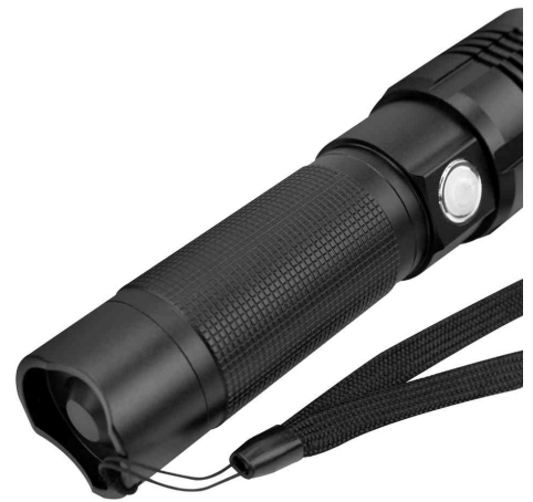
Akku LED-Taschenlampe Pro 3000R