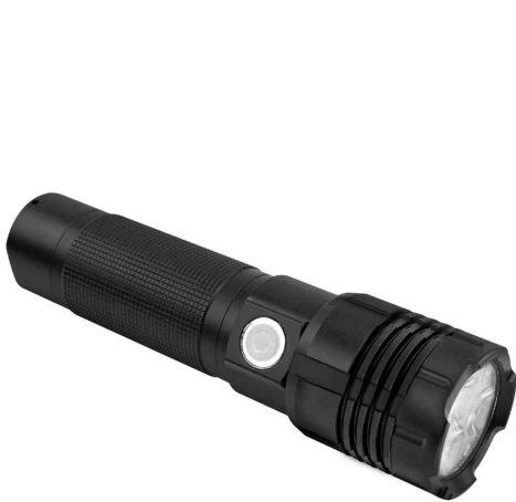
Akku LED-Taschenlampe Pro 3000R