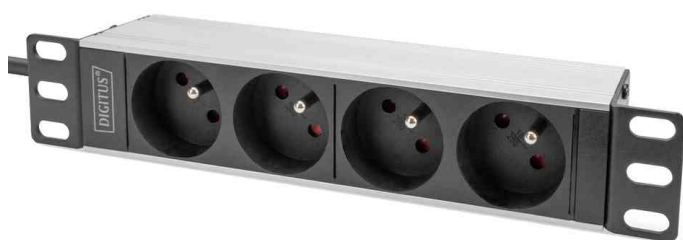
Multiprise 10", 1 U, 4 prises