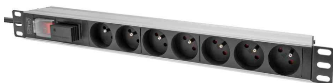
Multiprise 19" avec interrupteur