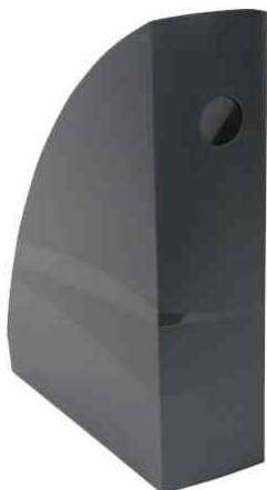
Stehsammler "MAG-CUBE", dunkelgrau