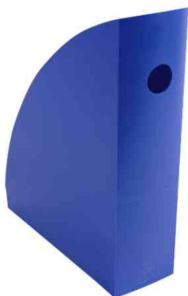
Stehsammler "MAG-CUBE", königsblau