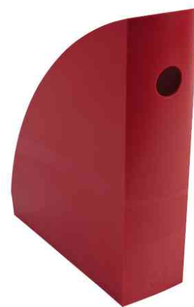
Stehsammler "MAG-CUBE", karminrot