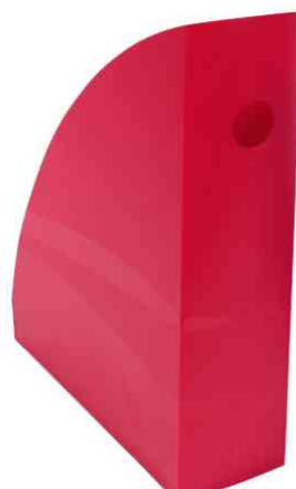
Stehsammler "MAG-CUBE", himbeere