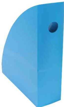
Stehsammler "MAG-CUBE", türkis