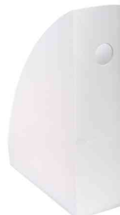
Stehsammler "MAG-CUBE", weiß