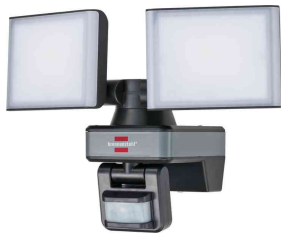
Connect WiFi Duo LED-Strahler WFD 3050 P