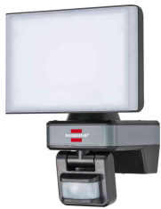
Connect WiFi LED-Strahler WF 2050 P