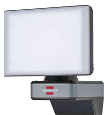
Connect WiFi LED-Strahler WF 2050