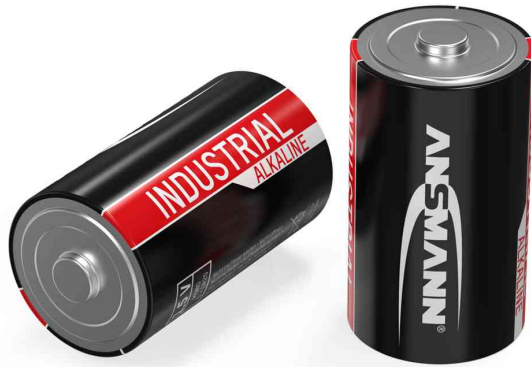
Alkaline Batterie "Industrial" Mono D

- geeignet für Anwendungen in der Industrie, Großverbraucher, Medizintechnik und Veranstaltungstechnik