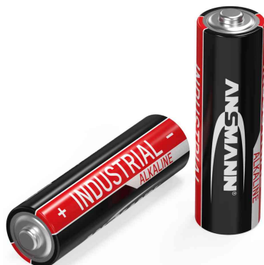
Alkaline Batterie "Industrial", Mignon AA

- geeignet für Anwendungen in der Industrie, Großverbraucher, Medizintechnik und Veranstaltungstechnik