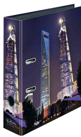
Motiv: Shanghai World Finance Center