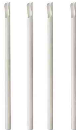
Papier-Trinkhalme mit Löffel "pure", weiß