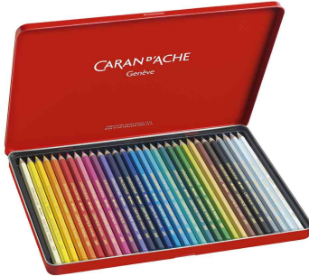
Farbübersicht 30er Metalltui