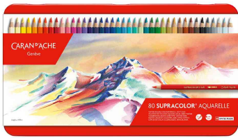
Buntstifte SUPRACOLOR® Aquarelle, 80er Metalltui