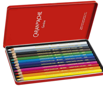
Farbübersicht 12er Metalltui