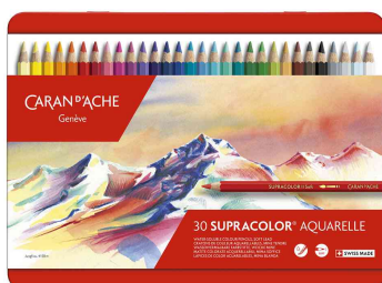
Buntstifte SUPRACOLOR® Aquarelle, 30er Metalletui