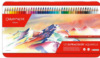
Buntstifte SUPRACOLOR® Aquarelle, 120er Metalltui