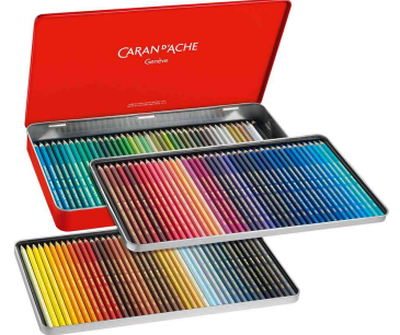
Farbübersicht 120er Metalltui