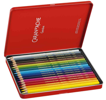
Farbübersicht 18er Metalltui