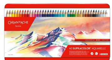
Buntstifte SUPRACOLOR® Aquarelle, 40er Metalletui