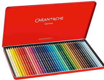
Farbübersicht 40er Metalltui