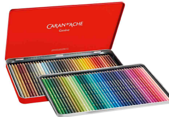
Farbübersicht 80er Metalltui