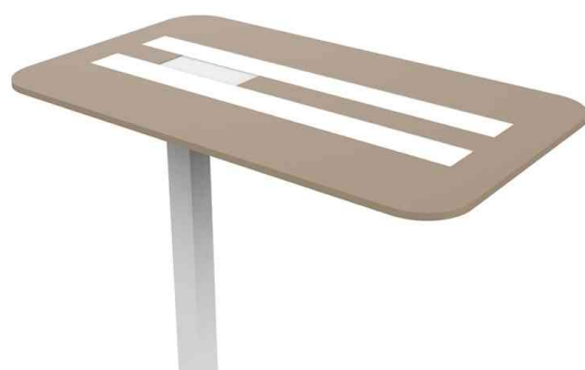
Detailansicht: Leuchtenkopf mit Akustikpanel