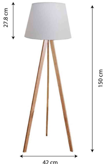
42 cm Detailansicht: Abmessungen