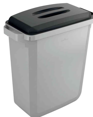
Abfallbehälter DURABIN ECO 60 mit optionalem Deckel