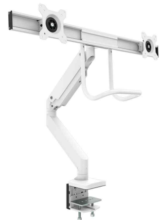
Doppel-Monitorarm Eppa Crossbar, weiß