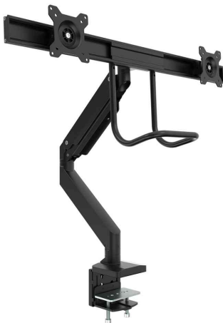
Doppel-Monitorarm Eppa Crossbar, schwarz

- ideal für Schreibtische mit Rückwand / Trennwand