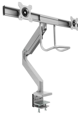
Doppel-Monitorarm Eppa Crossbar, silber