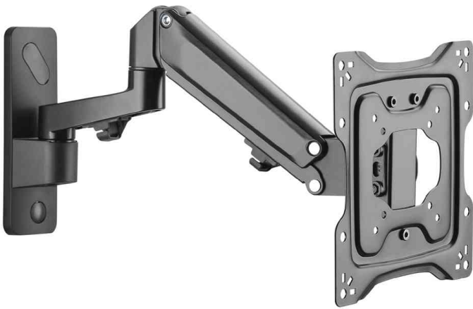
Universal Monitorarm zur Wandmontage